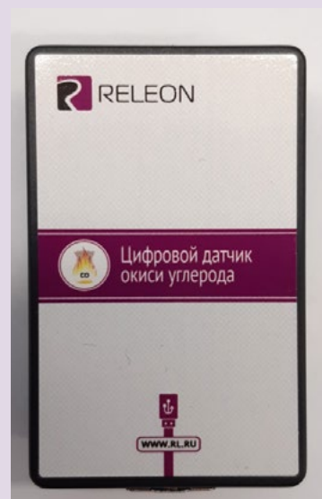
Рис. 11. Датчики кислорода (слева) и угарного газа (справа)