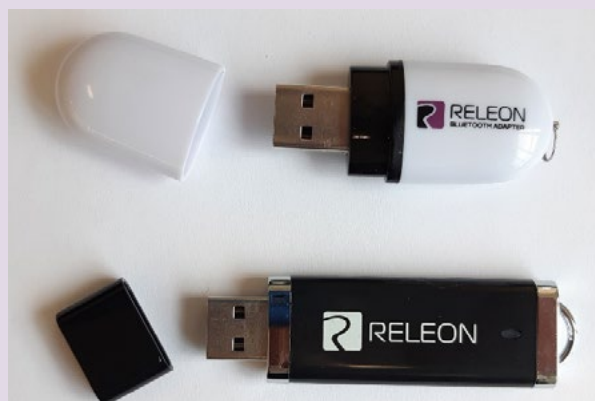
Рис. 13. Общий вид USB-флеш-накопителя (внизу) и Bluetooth-адаптера (вверху) Releon

В комплекте цифровой лаборатории Releon поставляется программное обеспечение Releon Lite на USB-флеш-накопителе, а также Bluetooth-адаптер для связи регистратора данных с беспроводными датчиками (рис. 13).