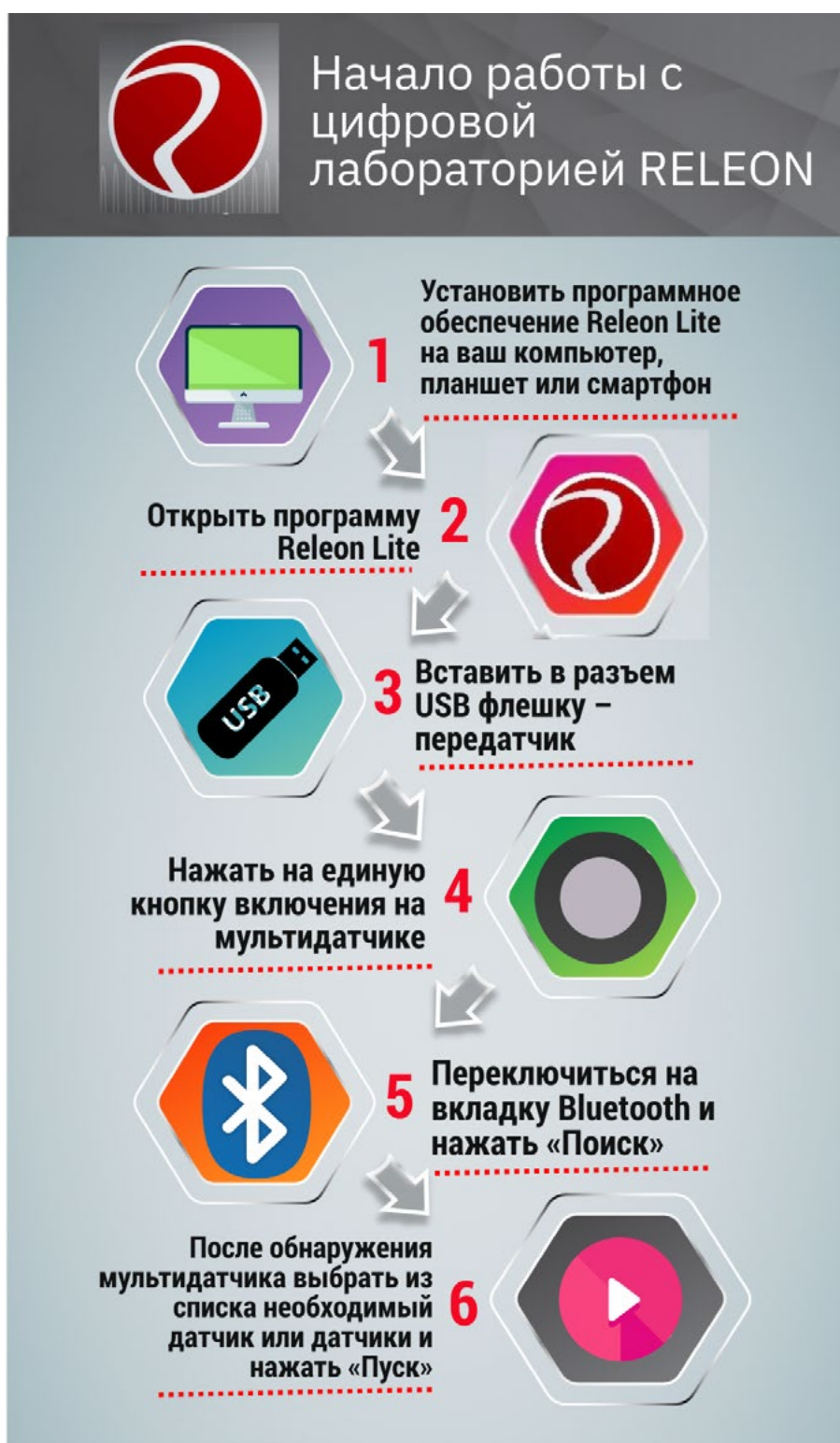
Рис. 14. Алгоритм работы с программным обеспечением Releon Lite

При изучении естественных наук в современной школе огромное значение имеет наглядность учебного материала. Наглядность даёт возможность быстрее и глубже усваивать изучаемую тему, помогает разобраться в трудных для восприятия вопросах, и повышает интерес к предмету.