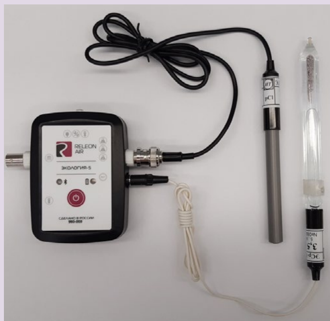
Рис. 10. Ионоселективный датчик (присоединены электро хлорид-ионов и электрод сравнения)

Датчик кислорода — предназначен для определения относительной концентрации кислорода в воздухе. Диапазон измерения: от 0 до 100 %. Разрешение: 0,1 %. Технологические особенности: при измерении содержания газа в выдыхаемом воздухе необходимо держать мембрану максимально близко ко рту; восстановление показаний на воздухе происходит через 1—2 минуты (время диффузии через мембрану).