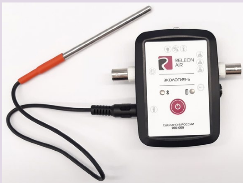
Рис. 6. Датчик температуры растворов

Датчик температуры термодатчик предназначен для измерения температур до 900. Используется при выполнении работ, связанных с измерением температур плавления и разложения веществ, а также для измерения температуры в экзотермических процессах.