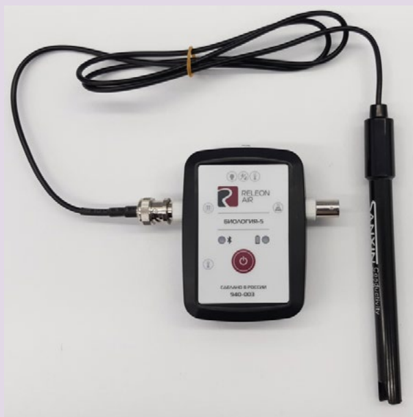
Рис. 5. Датчики электропроводимости

Датчик электропроводимости — предназначен для регистрации и измерения удельной электропроводности жидких сред, в том числе и водных растворов веществ. Применяется при изучении характеристик водных растворов, в том числе почвенных вытяжек.