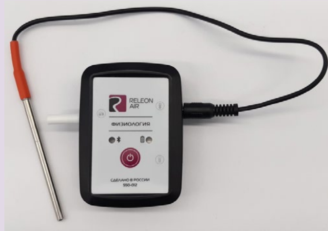
Рис. 12. Датчик температуры тела

Датчик температуры тела — предназначен для непрерывного измерения температуры тела в подмышечной впадине. Оснащён выносным зондом. Диапазон измерения: от 25 до 50 °С. Разрешение датчика: 0,1 °С. Технологическая особенность: для точного измерения в подмышечной впадине должна находиться вся металлическая часть зонда.